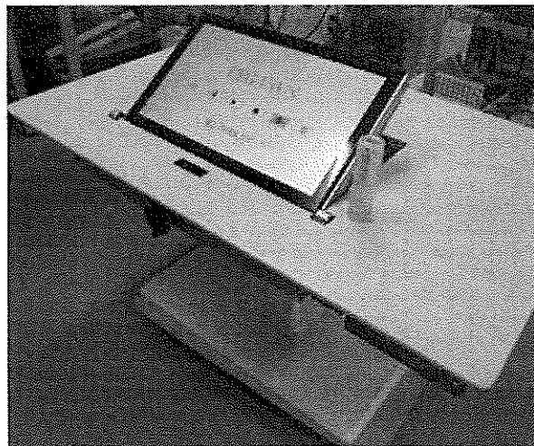
図2 電子ペグと電子ペグボード