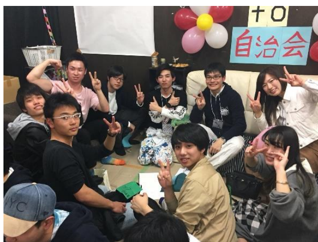
(昨年の活動の様子)