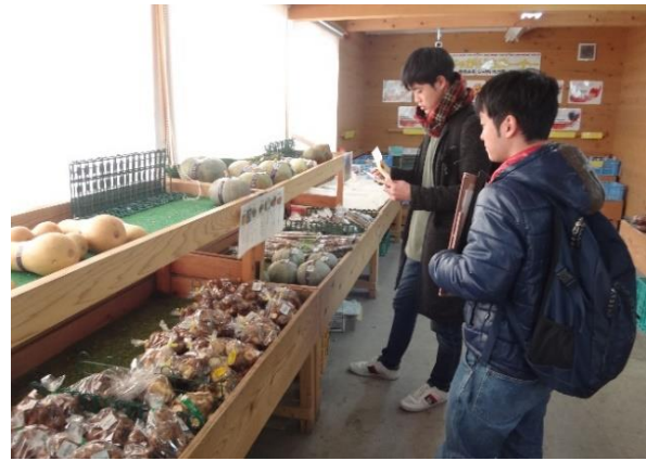
学生による道の駅の調査

同研究室は、昨年度の「道の駅」学生コンテスト(国土交通省主催)において、『むら・ひと・しごとの拠点へ あぐりーむ昭和』を提案し、奨励賞を受賞しました。これは産(群馬トヨペット)・官(昭和村、群馬県)・学(大学)が連携し、道の駅「あぐりーむ昭和」で販売する新鮮な農産物を都市部でも販売し、農村と都市の交流を促進しようというものです。これにより、昭和村のPR、農産物の価値の向上、人的交流の促進、雇用の創出などの効果が期待できます。プロジェクトの第一弾として、ことしの8月には、旬のトウモロコシなどの販売を群馬トヨペットの店舗で行ったところ、たくさんの方にお越しいただきました。採れたての農産物を都市部にお届けするとともに、来場して下さった皆さんが昭和村に足を運んでくださるきっかけづくりができたと思います。