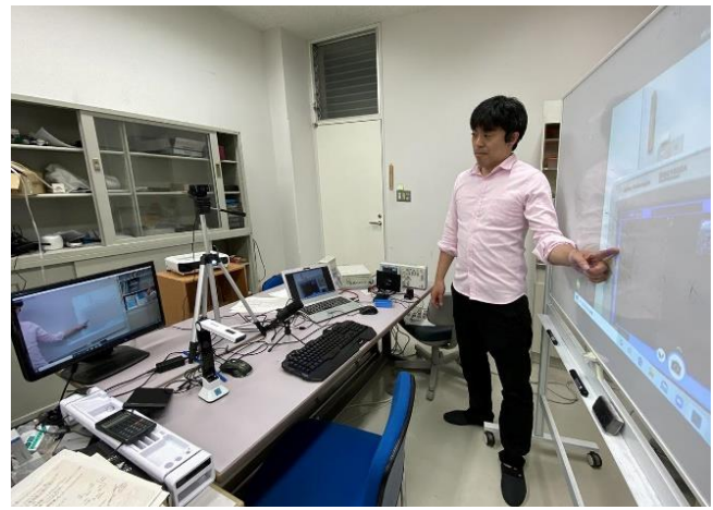
オンライン授業の様子

一方、これまでの対面授業だけでは見えなかった、教育の問題点をいくつも知ることができました。その意味では、こうした経験を加えて、特に学ぶ人にとってより意味のある教育が醸成されていくのではないかと感じています。