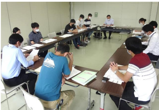
産官学の合同会議

上記のプロジェクトと並行して、新型コロナウイルス感染期における交通生活と生活意識の変容に関する研究も行っています。