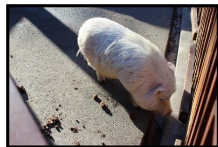
ブタより抽出した コラーゲン分子の顕微鏡写真